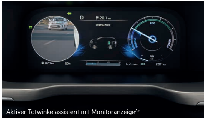
Aktiver Totwinkelassistent mit Monitoranzeige A+

Die modernen, intelligenten Assistenzsysteme helfen, das Fahren im Kia Sorento sicherer und entspannter zu machen.