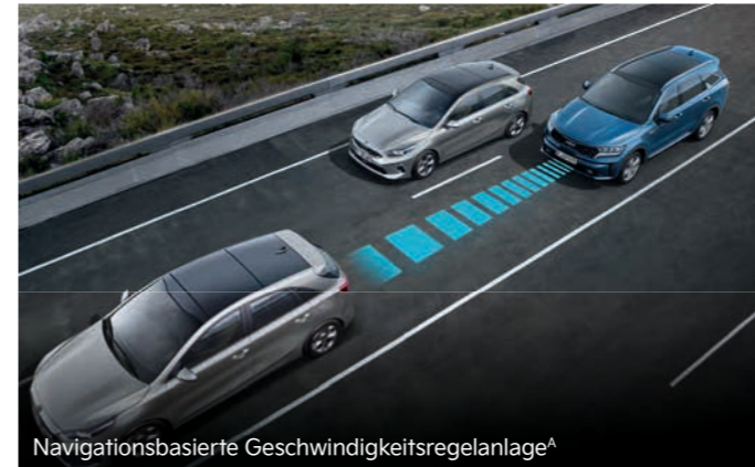
Navigationsbasierte Geschwindigkeitsregelanlage A

Der serienmäßige intelligente Geschwindigkeitsassistent (Intelligent Speed Limit Assist, ISLA) erkennt ein ausgeschildertes Tempolimit per Kamera, zeigt es in der Instrumenteneinheit sowie auf dem Navigationsbildschirm + an und bietet zudem die Möglichkeit, es automatisch in die Geschwindigkeitsregelanlage zu übernehmen.