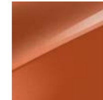
Orange Fusion Metallic (RNG)