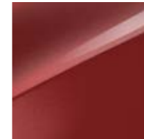
Infrarot Metallic (AA9)