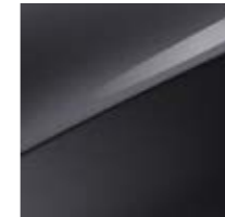
Pentametal Metallic (H8G)