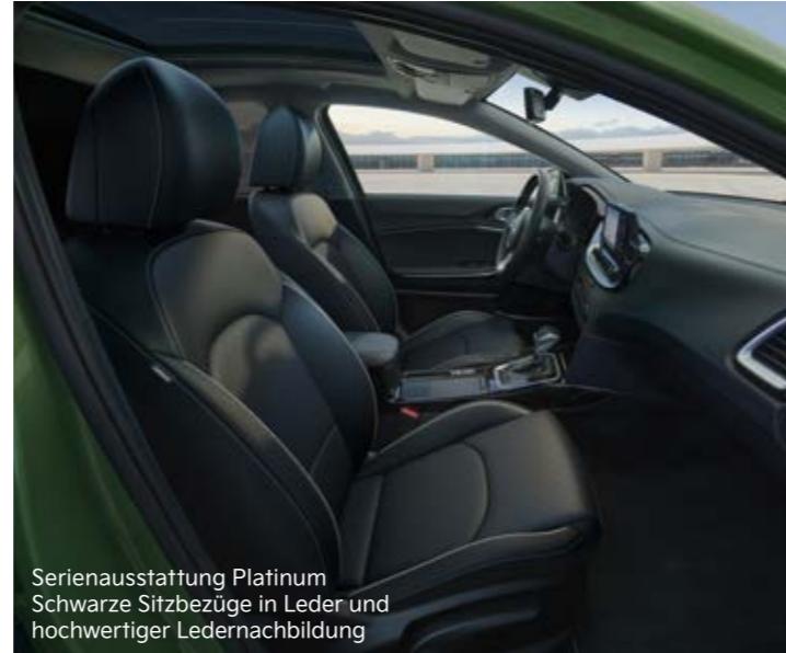
Serienausstattung Platinum Schwarze Sitzbezüge in Leder und hochwertiger Ledernachbildung