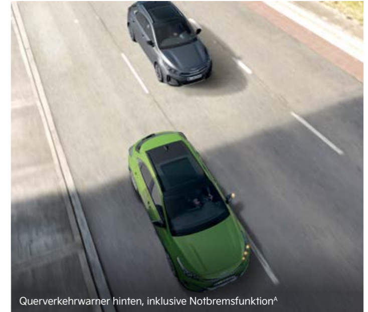
Querverkehrssensoren hinten, inklusive Notbremsfunktion A

Der serienmäßige Spurfolgeassistent (Lane Follow Assist, LFA) hält deinen Kia mittig in der Fahrspur, wobei die Hände am Lenkrad bleiben müssen, und orientiert sich mithilfe von Sensoren am vorausfahrenden Verkehr. Aktiv ist das System von 0 bis 130 km/h. Lenkunterstützung bietet auch der ebenfalls serienmäßige Spurhalteassistent mit korrigierendem Lenkeingriff (Lane Keeping Assist, LKA). Er weist dich visuell und akustisch darauf hin, wenn dein Kia seine Fahrspur unbeabsichtigt verlässt und lenkt gleichzeitig geringfügig gegen, um ihn in der Spur zu halten.