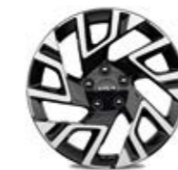
18-Zoll- Leichtmetallfelgen (optional)

Bei einigen unserer modernen Metallicfarben werden bewusst unterschiedliche Farbpigmente verwendet. Dadurch können unter bestimmten Lichtverhältnissen, z.B. direktes Sonnenlicht, attraktive Farbeffekte erzielt werden. Zum Teil kann die Farbe changieren, z.B. von Schwarz zu Dunkelblau. Bei den hier abgebildeten Farbdarstellungen kann es aufgrund der Drucktechnik zu Abweichungen zu den Originalfarben kommen. Weitere Informationen zu den Farbeffekten und Grundfarben erhältst du bei deinem Kia-Partner. Metalliclackierungen sind aufpreispflichtig.