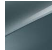
Yucca Stahlgrau Met. (USG)