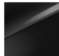
Zilinaschwarz Metallic (1K)