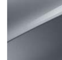
Lunarsilber Metallic (CSS)