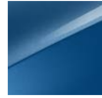
Blue Flame Metallic (B3L)