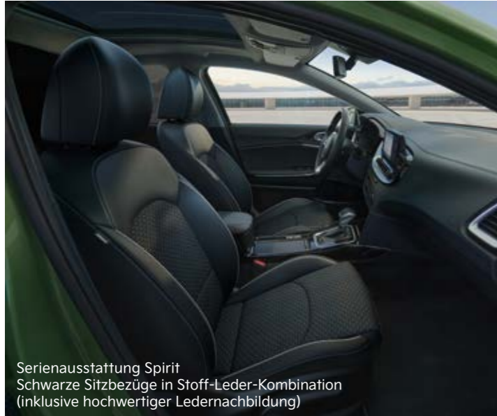
Serienausstattung Spirit Schwarze Sitzbezüge in Stoff-Leder-Kombination (inklusive hochwertiger Ledernachbildung)

Stilvolles Design kombiniert mit hochwertigen Sitzbezügen aus verschiedenen Materialien: Im Kia XCeed Plug-in Hybrid kannst du dich jederzeit wohlfühlen.