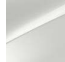
Deluxeweiß Metallic (HW2)