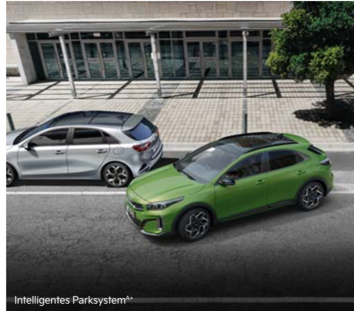
Intelligentes Parksystem A+

Der serienmäßige Müdigkeitssensoren (Driver Attention Warning, DAW) analysiert ständig verschiedene Fahrzeugparameter wie die Betätigung von Lenkrad und Blinker, die Beschleunigungsmuster und die Gesamtdauer der Fahrzeit. Erkennt das System Zeichen von Erschöpfung, weist es dich durch einen Warnton und eine Anzeige in der Instrumenteneinheit darauf hin.