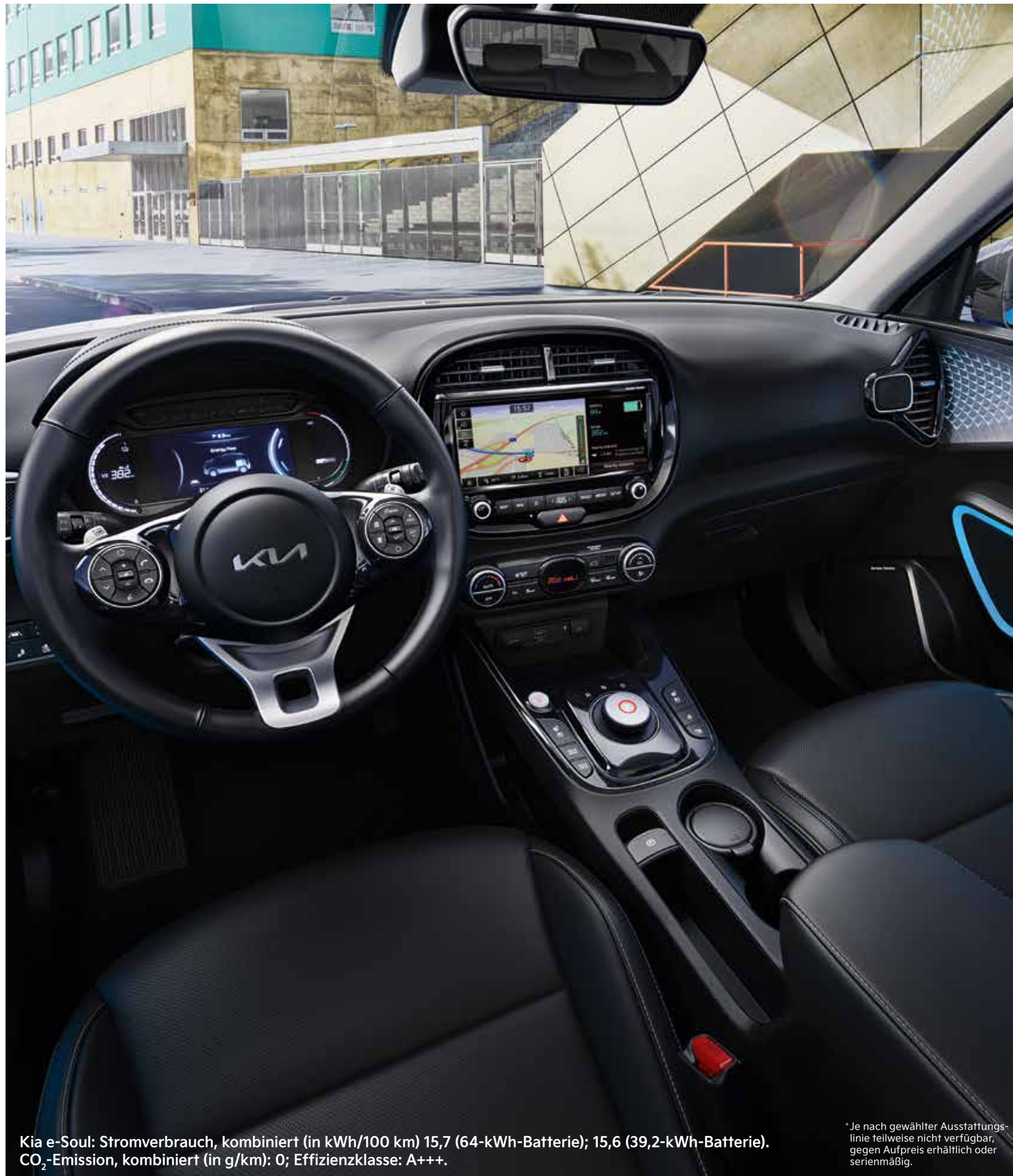
Kia e-Soul: Stromverbrauch, kombiniert (in kWh/100 km) 15,7 (64-kWh-Batterie); 15,6 (39,2-kWh-Batterie). CO 2 -Emission, kombiniert (in g/km): 0; Effizienzklasse: A+++.

* Je nach gewählter Ausstattungslinie teilweise nicht verfügbar, gegen Aufpreis erhältlich oder serienmäßig.