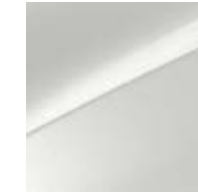
Deluxeweiß Metallic (HW2)