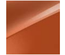
Orange Fusion Metallic (RNG)