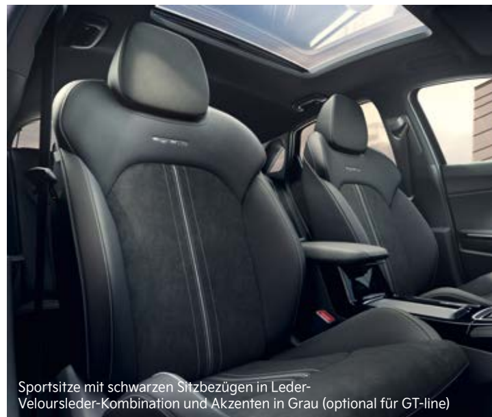
Sportsitze mit schwarzen Sitzbezügen in Leder-Veloursleder-Kombination und Akzenten in Grau (optional für GT-line)