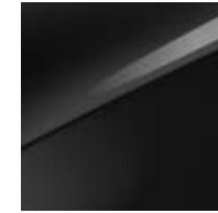
Zilinaschwarz Metallic (1K)