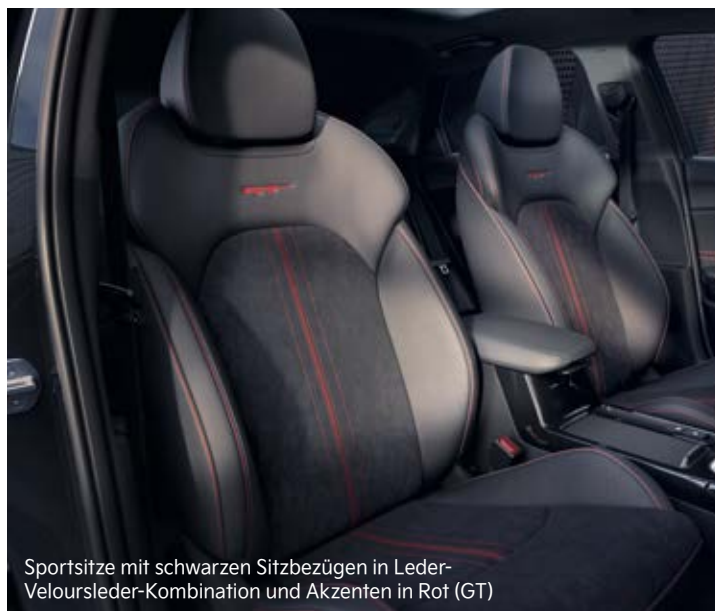
Sportsitze mit schwarzen Sitzbezügen in Leder-Veloursleder-Kombination und Akzenten in Rot (GT)