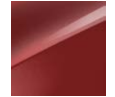
Infrarot Metallic (AA9)