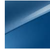
Blue Flame Metallic (B3L)