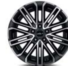
18-Zoll-Leichtmetallfelgen (optional für GT-line)