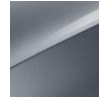
Lunarsilber Metallic (CSS)