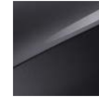
Pentametal Metallic (H8G)