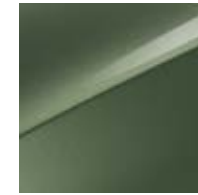
Experience Grün Metallic (EXG)

Bei einigen unserer modernen Metallicfarben werden bewusst unterschiedliche Farbpigmente verwendet. Dadurch können unter bestimmten Lichtverhältnissen, z.B. direktes Sonnenlicht, attraktive Farbeffekte erzielt werden. Zum Teil kann die Farbe changieren, z.B. von Schwarz zu Dunkelblau. Bei den hier abgebildeten Farbdarstellungen kann es aufgrund der Drucktechnik zu Abweichungen zu den Originalfarben kommen. Weitere Informationen zu den Farbeffekten und Grundfarben erhältst du bei deinem Kia-Partner. Metalliclackierungen sind aufpreispflichtig.